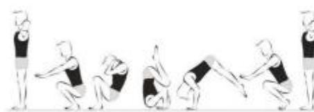
Rolamento à retaguarda (10%)