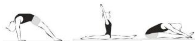
Posição de flexibilidade (ponte, espargata, 'sapo') (10%)

Dos últimos dois elementos o candidato escolhe uma posição de equilíbrio e uma de flexibilidade.