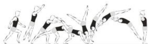
Salto de mãos à frente (10%)