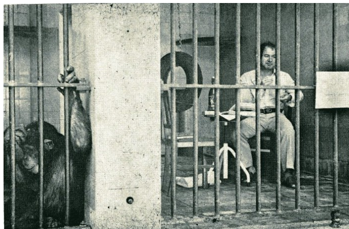
Imagem 4 © Jacques Minassian