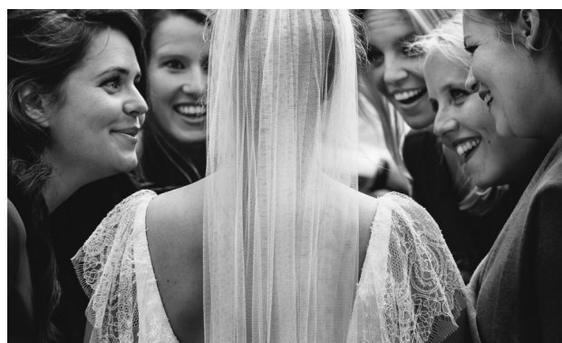
Imagem 2